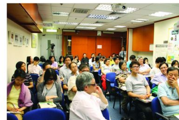
是次對談，吸引了不少信徒和牧者參加。