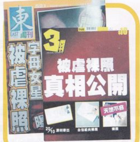
第521期《東周刊》及第160期《3周刊》 (10月30日出版) 及 (11月2日出版)