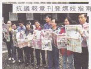
抗議報章刊登嫖妓指南

行動 ——當面對十分嚴重的問題時，明光社會聯合其他機構，以行動回應。較大型的行動包括於 1998 年就陳健康事件及兩間電視台播放『電波少女』進行請願，於 2000 年進行一連串罷買有嫖妓資訊報刊的行動。於 2001 年間更與其他機構一起成立『基督教反對賭波合法化大聯盟』，發起『向賭博說不！』反對賭波合法化的遊行集會，約 1,500 名基督徒參與。此外還有其他街頭簽名運動、聯署登報及記者招待會等等。