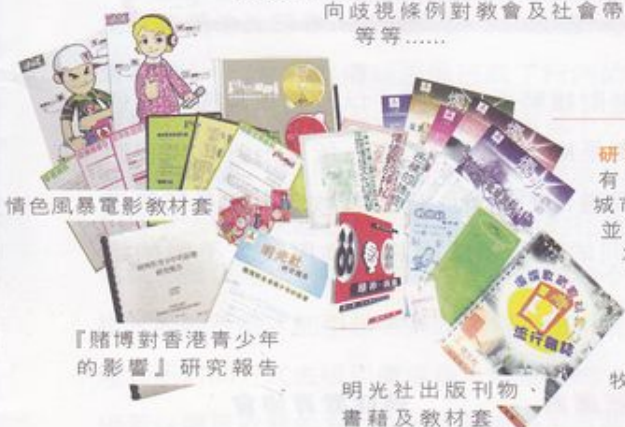
『賭博對香港青少年的影響』研究報告