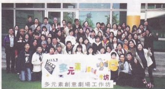
多元素創意劇場工作坊