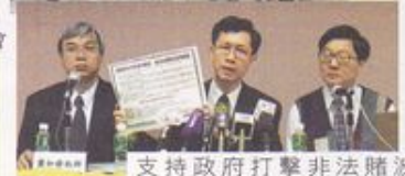
支持政府打擊非法賭波 反對以規範化混淆視聽