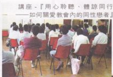
講座 - 『用心聆聽、體諒同行 ——如何關愛教會內的同性戀者』