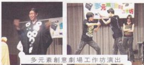
多元素創意劇場工作坊演出

活動——明光社在過去曾成功申請不同的基金舉辦各類型活動，為中、小學生提供活動教學。計有《傳媒與你》徵文比賽、《多元素創意劇場工作坊》、《小记者訓練計劃》及《賭本大搜查》標語設計比賽等等。