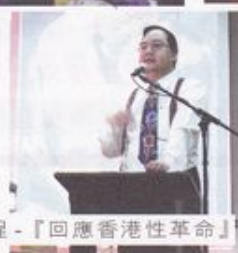
課程 - 『回應香港性革命』