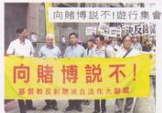
向賭博說不！遊行集會