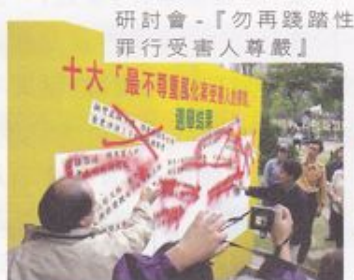
研討會 - 『勿再踐踏性 罪行受害人尊嚴』