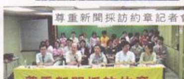
尊重新聞採訪約章記者會