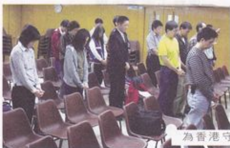
為香港守望祈禱會