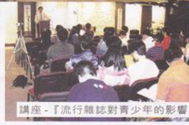
講座 - 『流行雜誌對青少年的影響』