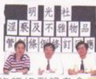
回應淫褻及不雅物品管制修訂條例記者會